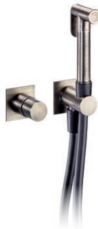
Miscelatore bidet Bidet mixer Melangeur bidet