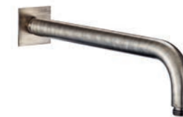
Braccio doccia Shower arm Bras de douche