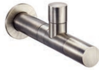
Miscelatore lavabo Basin mixer Melangeur lavabo