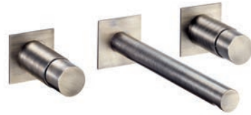
Rubinetto lavabo Basin tap Robinet lavabo