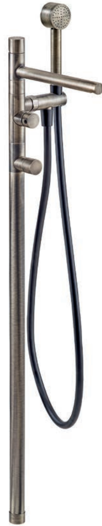
Miscelatore vasca Bath mixer Melangeur bain