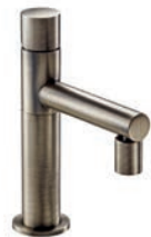
Miscelatore bidet Bidet mixer Melangeur bidet