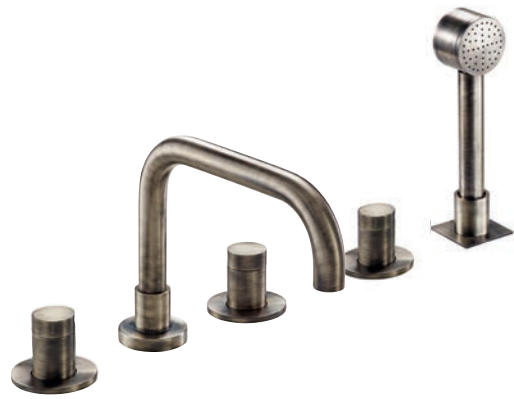
Rubinetto vasca Bath tap Robinet bain