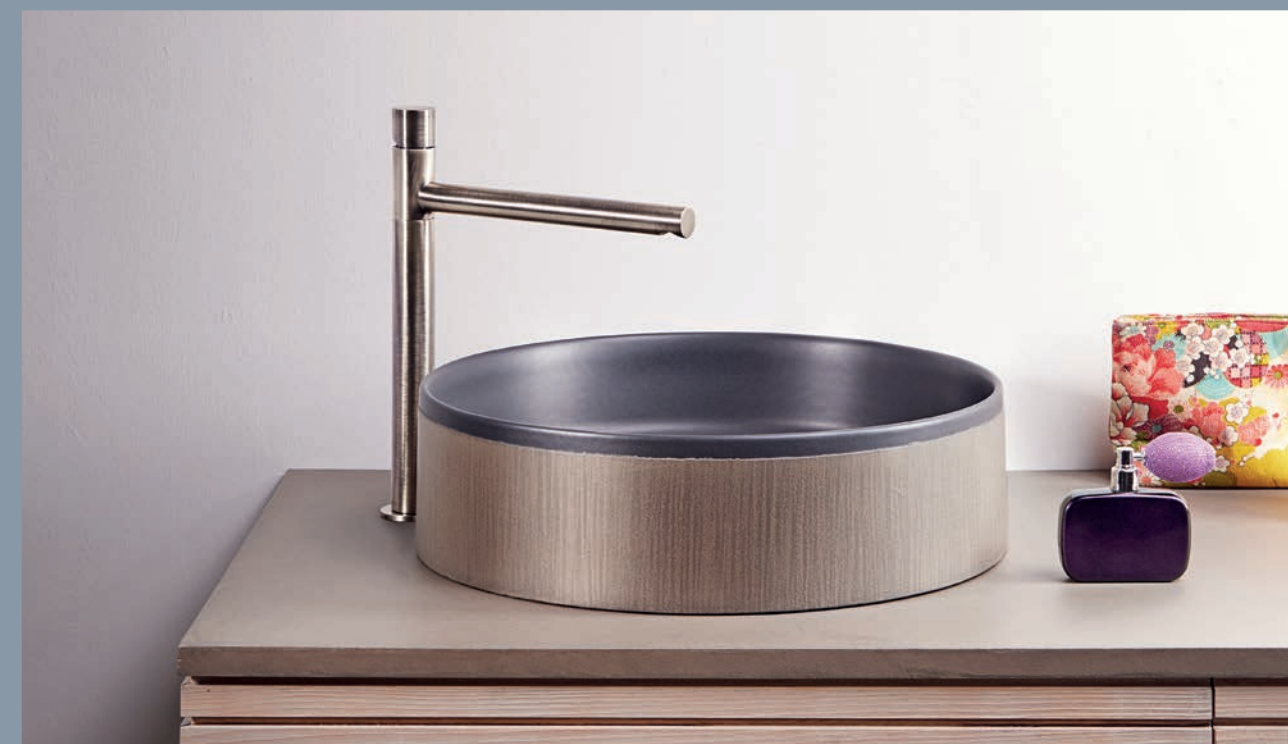
ZC120102 FE >> miscelatore lavabo basin mixer mitigeur lavabo.