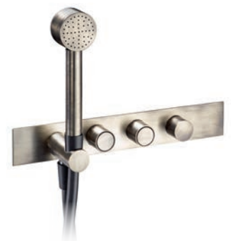
Miscelatore doccia Shower mixer Melangeur douche