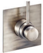
Termostatico doccia Shower thermostatic Thermostatique douche