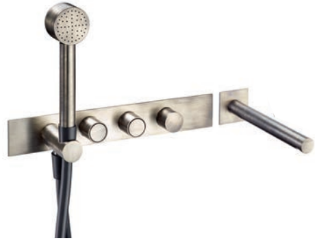
Miscelatore vasca Bath mixer Melangeur bain