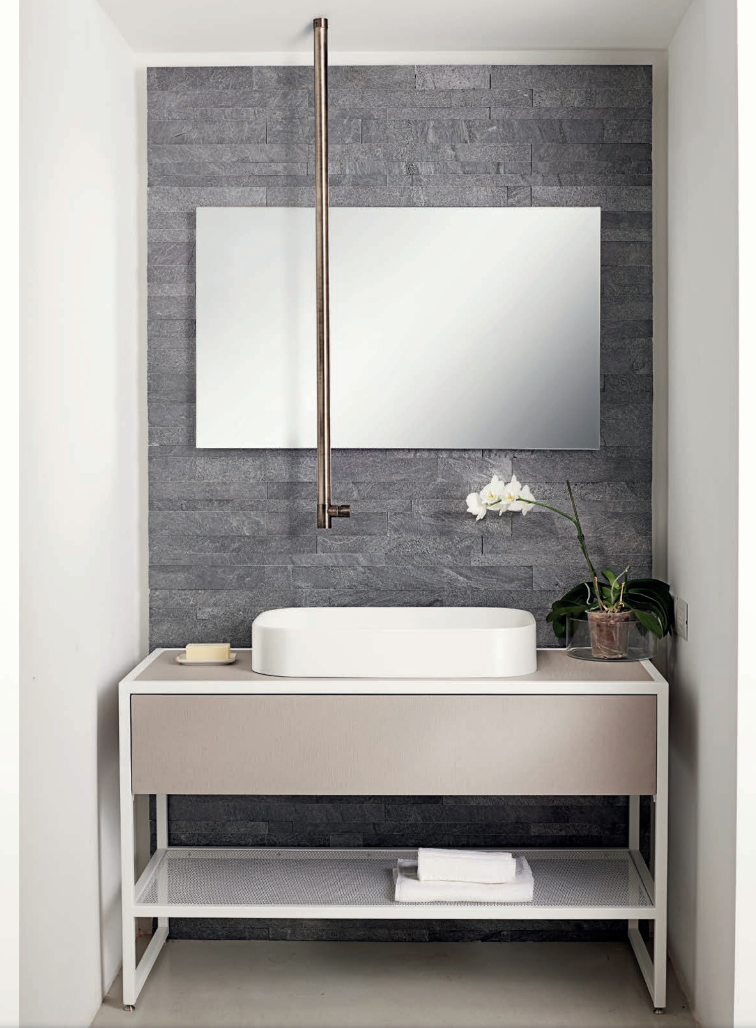
ZC120110 FE » miscelatore lavabo basin mixer mitigeur lavabo