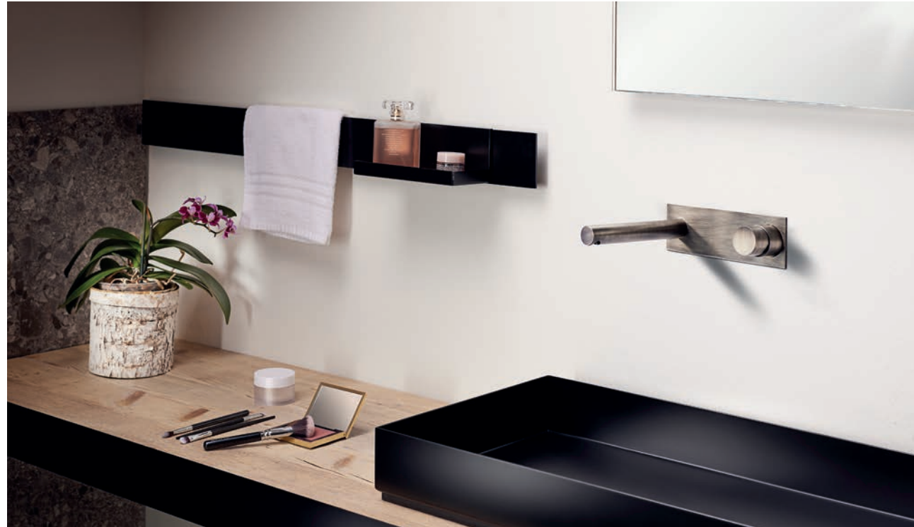
» ZC120104 FE miscelatore lavabo basin mixer mitigeur lavabo