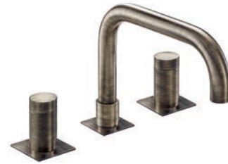
Rubinetto lavabo Basin tap Robinet lavabo