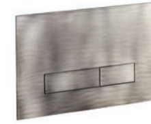
Piastra wc Wc plate Plaque de wc